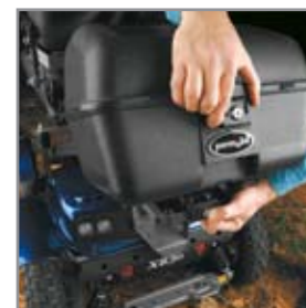
Caja de equipaje fácil de desmontar