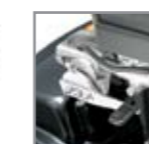
Rotación de 180° del asiento, manual o eléctrica