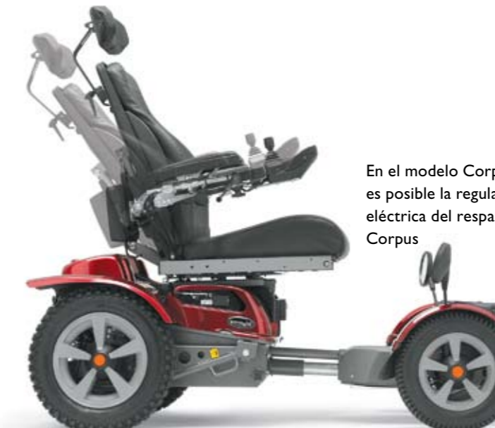
En el modelo Corpus es posible la regulación eléctrica del respaldo Corpus