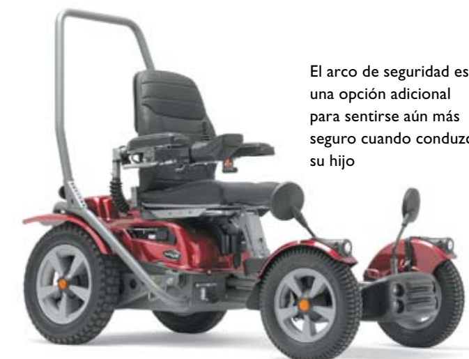
El arco de seguridad es una opción adicional para sentirse aún más seguro cuando conduzca su hijo