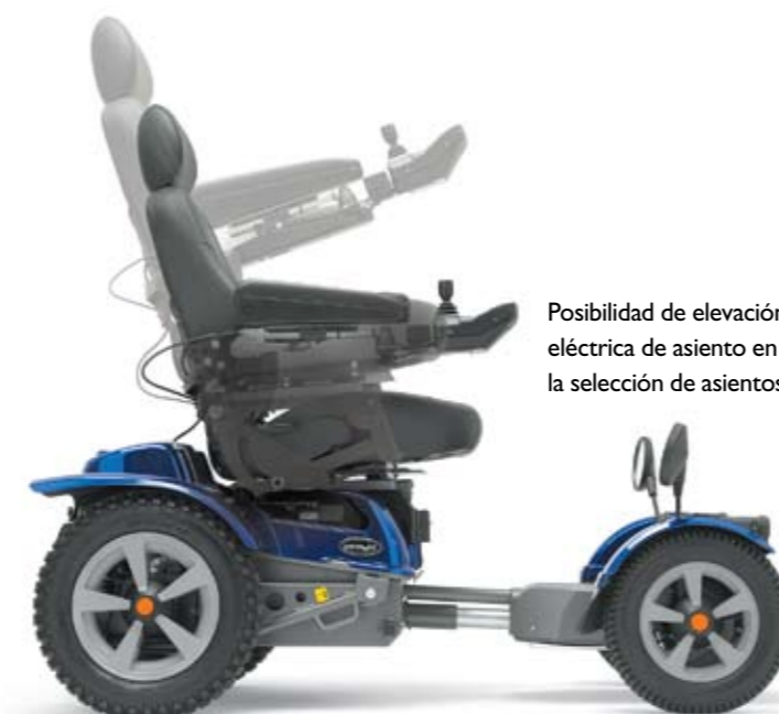
Posibilidad de elevación eléctrica de asiento en toda la selección de asientos