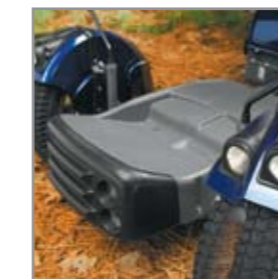
Luces multidireccionales activas