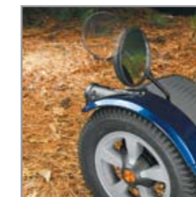
Retrovisores con suspensión que no se enganchan en los obstáculos