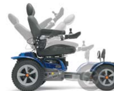
Regulación manual del respaldo