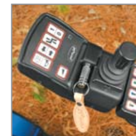
LLave para bloqueo en cuadro de mandos