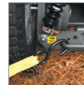
Enganches para el transporte