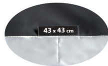
Etiqueta trasera de la funda con las dimensiones.