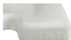
Identificación de las medidas del cojín sobre la espuma.