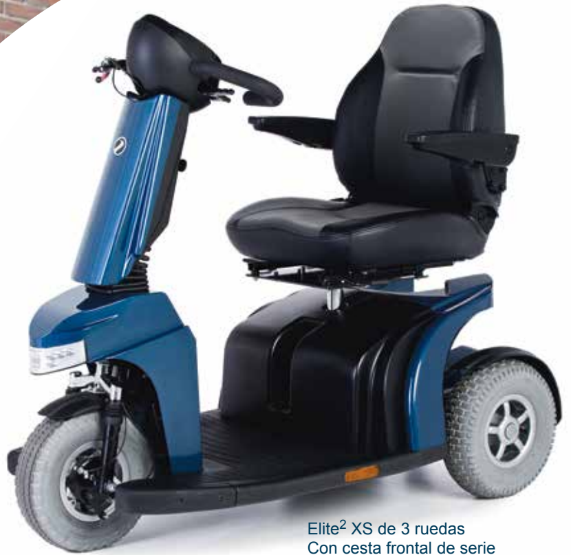
Elite 2 XS de 3 ruedas Con cesta frontal de serie

Confort, velocidad y rendimiento en exteriores