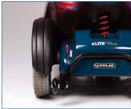
Guardabarros, ruedas antivuelco y parachoques trasero de serie.