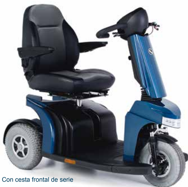
Con cesta frontal de serie