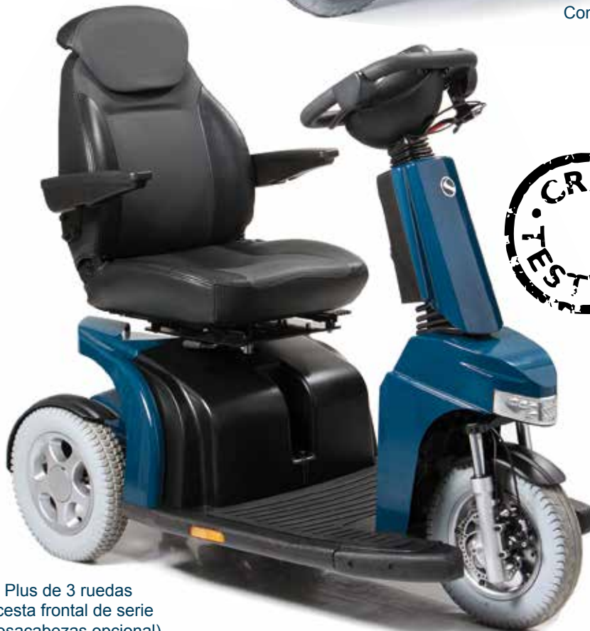
Elite 2 Plus de 3 ruedas Con cesta frontal de serie (Reposacabezas opcional)