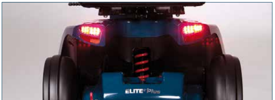
Elite 2 Plus ofrece unos resultados de conducción inmejorables gracias a su avanzado sistema de suspensión, que permite un movimiento de hasta 85 mm en la suspensión trasera y 50 mm en la delantera.