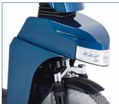
Visibilidad garantizada gracias a las luces de LED; luces delanteras y traseras, indicadores y luces de frenado.

Con asiento acolchado de gran calidad y múltiples ajustes para que el usuario pueda encontrar en todo momento la posición que le resulte más cómoda.