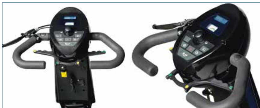
Amplias empuñaduras ergonómicas y palanca de control manejable con un dedo. Manillar ajustable en ángulo para asegurar el confort y una buena postura durante la conducción.