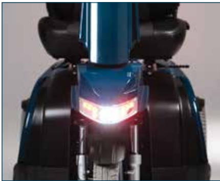
Visibilidad garantizada gracias a las luces de LED; luces delanteras y traseras, indicadores y luces de frenado.

A través de los botones del cuadro puede controlar los perfiles de conducción (interiores/exteriores), las luces y los indicadores.