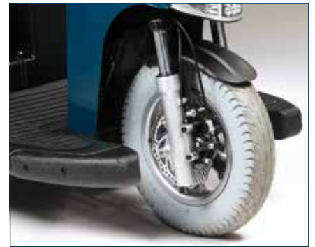
Ruedas grandes de 14" con llanta de aluminio y alto perfil para incrementar la tracción. Amortiguación delantera y frenos de disco.