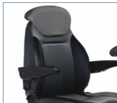
Asiento acolchado, giratorio 360°, ajustable y con soporte lateral lumbar. Extensión de respaldo opcional.