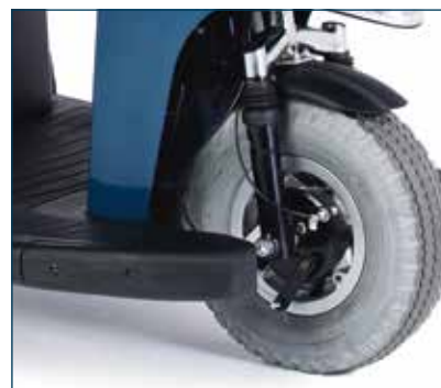
Ruedas delanteras de 13" con amortiguación delantera para una conducción más cómoda.