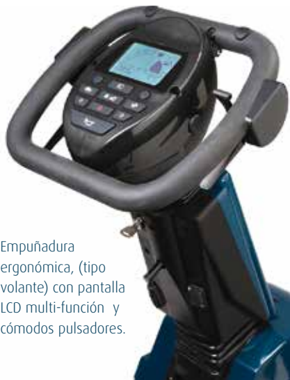
Empuñadura ergonómica, (tipo volante) con pantalla LCD multi-función y cómodos pulsadores.