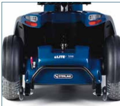
Suspensión trasera ajustable, guardabarros, ruedas antivuelco y parachoques trasero de serie.