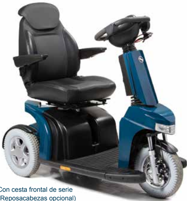
Con cesta frontal de serie (Reposacabezas opcional)