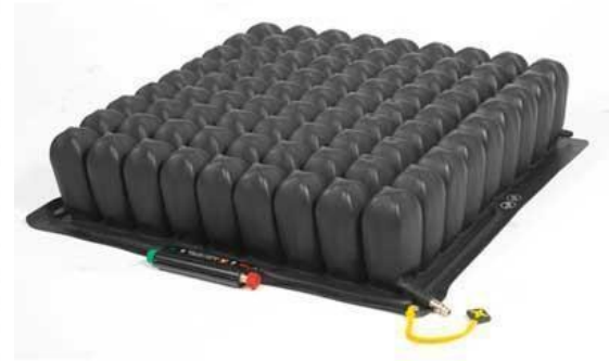
Cojín de aire.

Riesgo alto o muy alto (menos de 12 puntos)