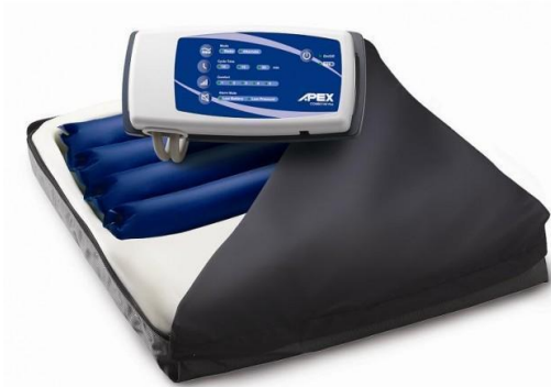
Cojín antiescaras con presión alternante.