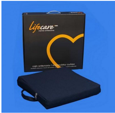
Cojín antiescaras 100 % silicona