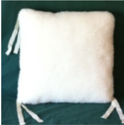
Cojín de borreguito o lana natural.