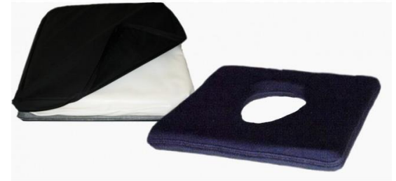
Cojín de flotación líquida económico.