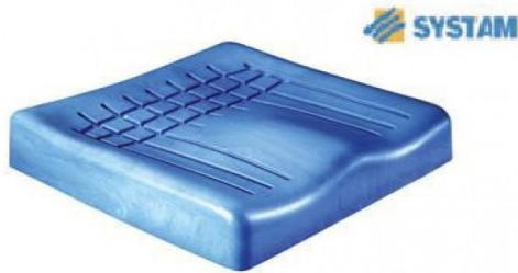
Cojín antiescaras viscoelástica de alta densidad.