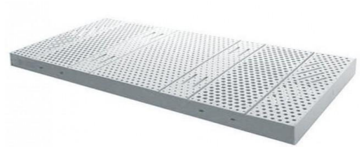
Colchón de látex.