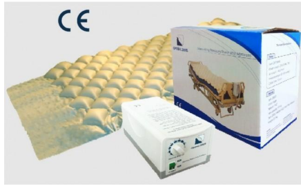
Colchón antiescaras de aire de burbujas.