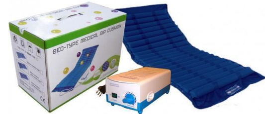
Colchón antiescaras de aire con tubos de nylon.